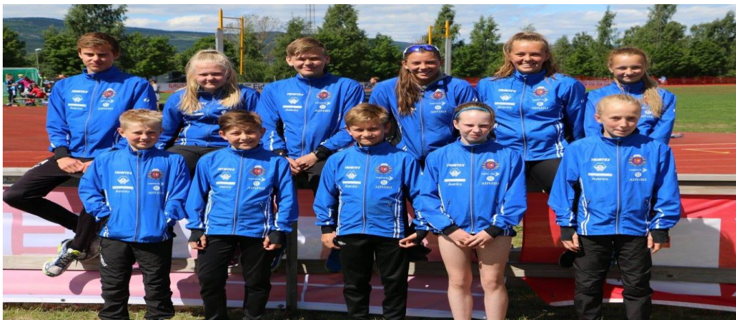
ÅFIK'ere på Veidekkelekene på Lillehammer.

Det har vært stor deltakelse på stevner lokalt, regionalt, nasjonalt og internasjonalt.