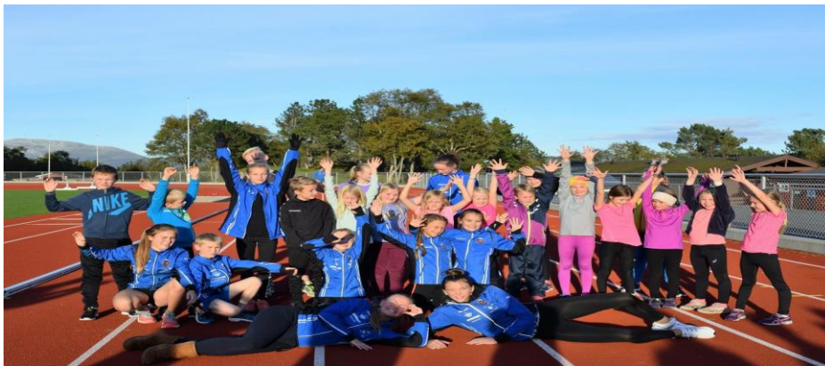
Seriestevne i strålende solskinn 3 okt.

DNB Akslalekene, Aksla stadion. Valder IL og ÅFIK.