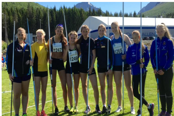
Mange flotts spydkastere i Møre og Romsdal. Her på banestevne i Måndalen.