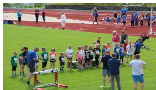
SBM Akslaleikan 2017

SBM Akslalekene, Aksla stadion. Valder IL og ÅFIK