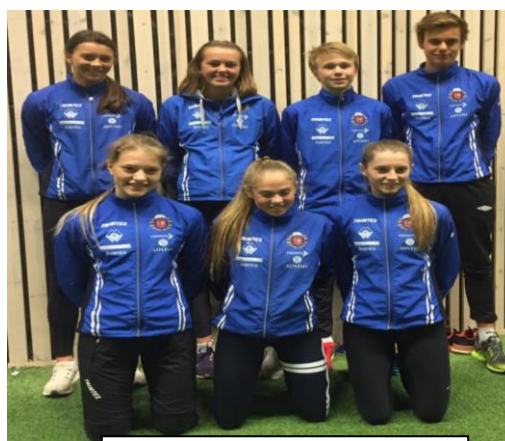
Klubb troppen på UM innadørs.

UM innendørs, Bærum. 7 utøvere. UM – Mangekamp. Bergen. 2 utøvere. Junior NM, Harstad. 2 utøvere. UM, Fana, 8 utøvere. NM terrengløp, Jr. 1 utøver. Hoved NM innendørs, Dimna, 4 utøver Hoved NM, Sandnes, 1 utøver