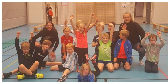
Rekrutt trening i Spjelkavikhallen