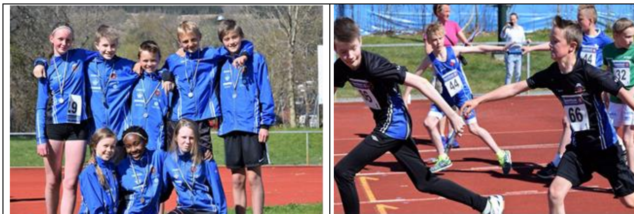
ÅFIK`ere på Ørstastafetten.

Utøvere fra ÅFIK har deltatt på stevner lokalt, regionalt, nasjonalt og internasjonalt.